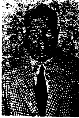
من مؤلفاته :